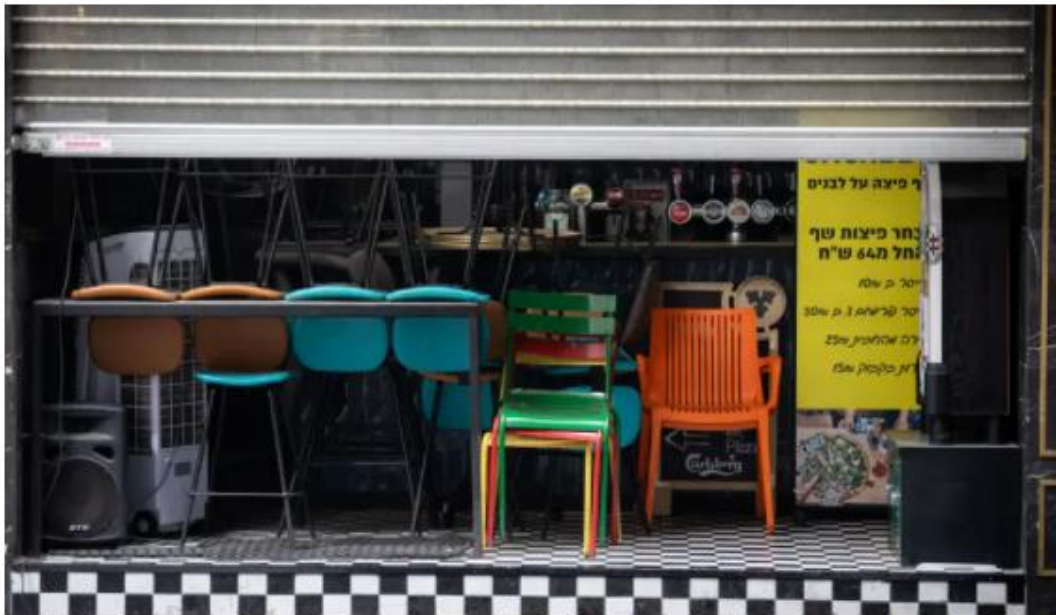
מסעדה סגורה בשדרות רוטשילד בתל אביב.

לדבריו, כדי לפתור את הבעיה, הוא פנה בשבוע שעבר לסניף הבנק שלו וביקש לדחות בכמה חודשים את תחילת פירעון הלוואה. "אמרתי להם שאני עדיין לא מסוגל לשלם ושאלתי אם הם יכולים לעזור לי - התשובה שקיבלתי היתה שבאופן כללי ניתן לדחות החזרים של הלוואות, אבל לא הלוואות בערבות מדינה, אז הם נאלצים לסרב".