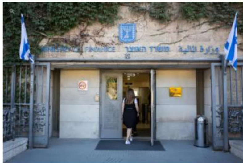
משרד האוצר